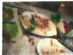
Restes de repas