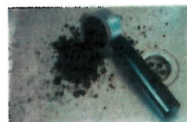
Marc de café