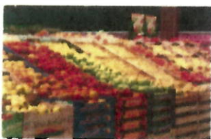
Fruits et légumes en vrac et emballés