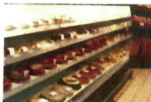
Traiteur à la coupe et en libre-service