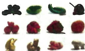
Fruits et légumes (épluchures et produits abimés)

Restauration : les principaux biodéchets qui doivent être triés et valorisés