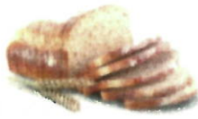
Restes de pain