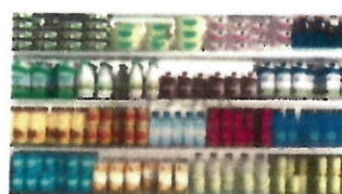
Libre-service produits laitiers