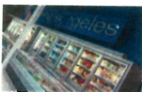
Surgelés en vrac et plats préparés