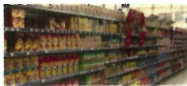
Rayons épicerie alimentaires en libre-service

Concernant les biodéchets en commerce alimentaires contenant des SPA de catégorie 3, il convient de distinguer ceux dits « crus » et ceux dits « cuits ».